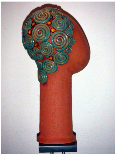
„Lockenkopf“ Keramik glasiert